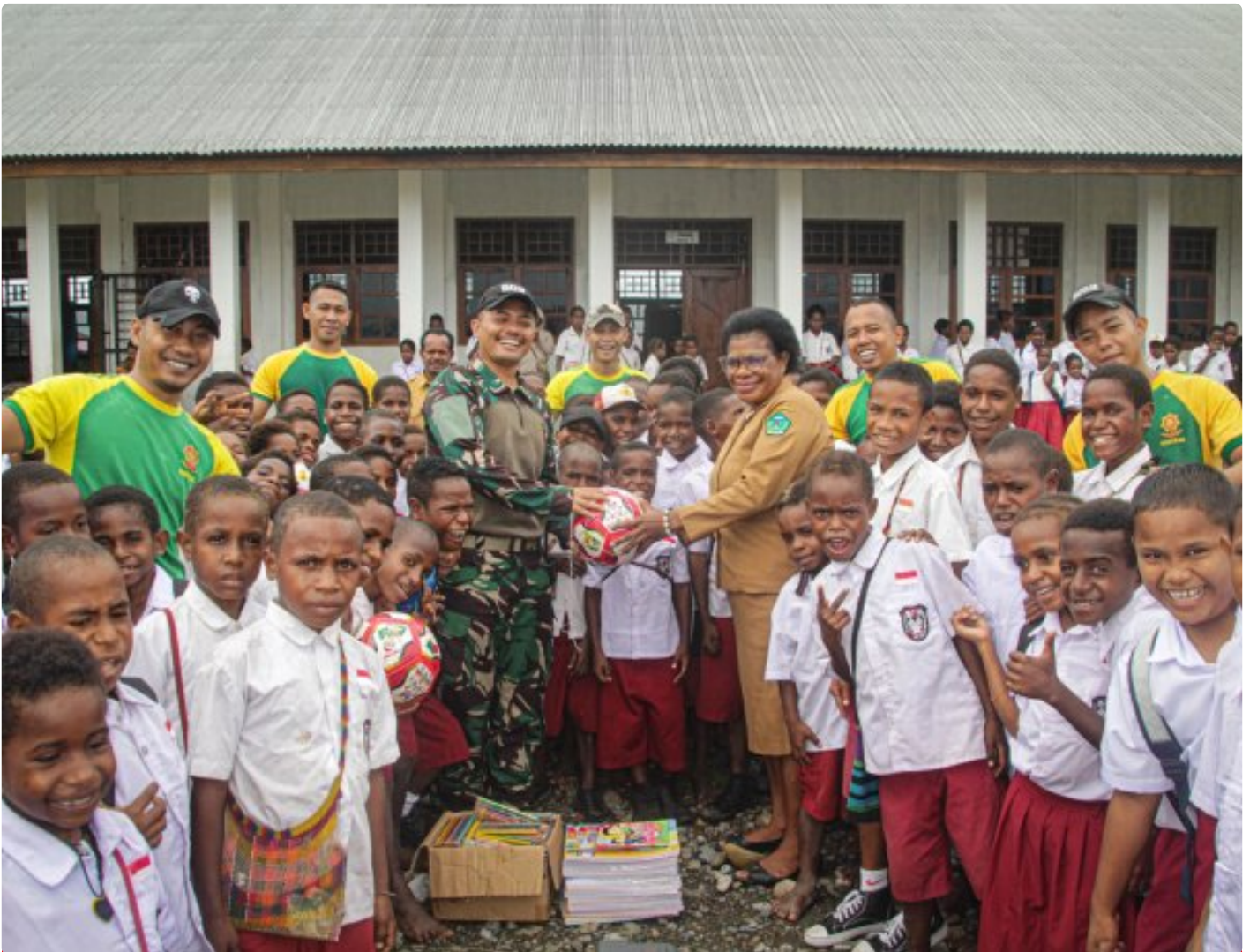
Foto: Satgas Pamtas Mobile RI-PNG Yonif 503/Mayangkara mendistribusikan sarana belajar ke SD Gabungan Distrik Kenyam, Kabupaten Nduga, Papua, pada Minggu (09/02/2025).