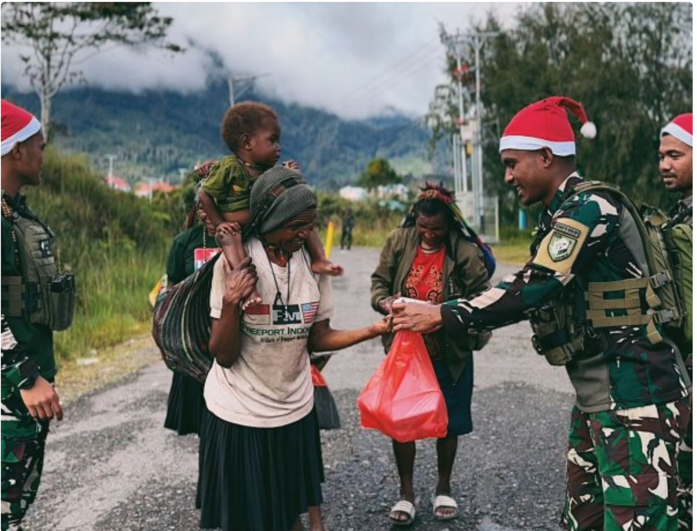
Foto: Satgas Yonif 509 Kostrad memberikan makna baru pada patroli keamanan dengan berbagi kebahagiaan bersama masyarakat di Intan Jaya, Papua.