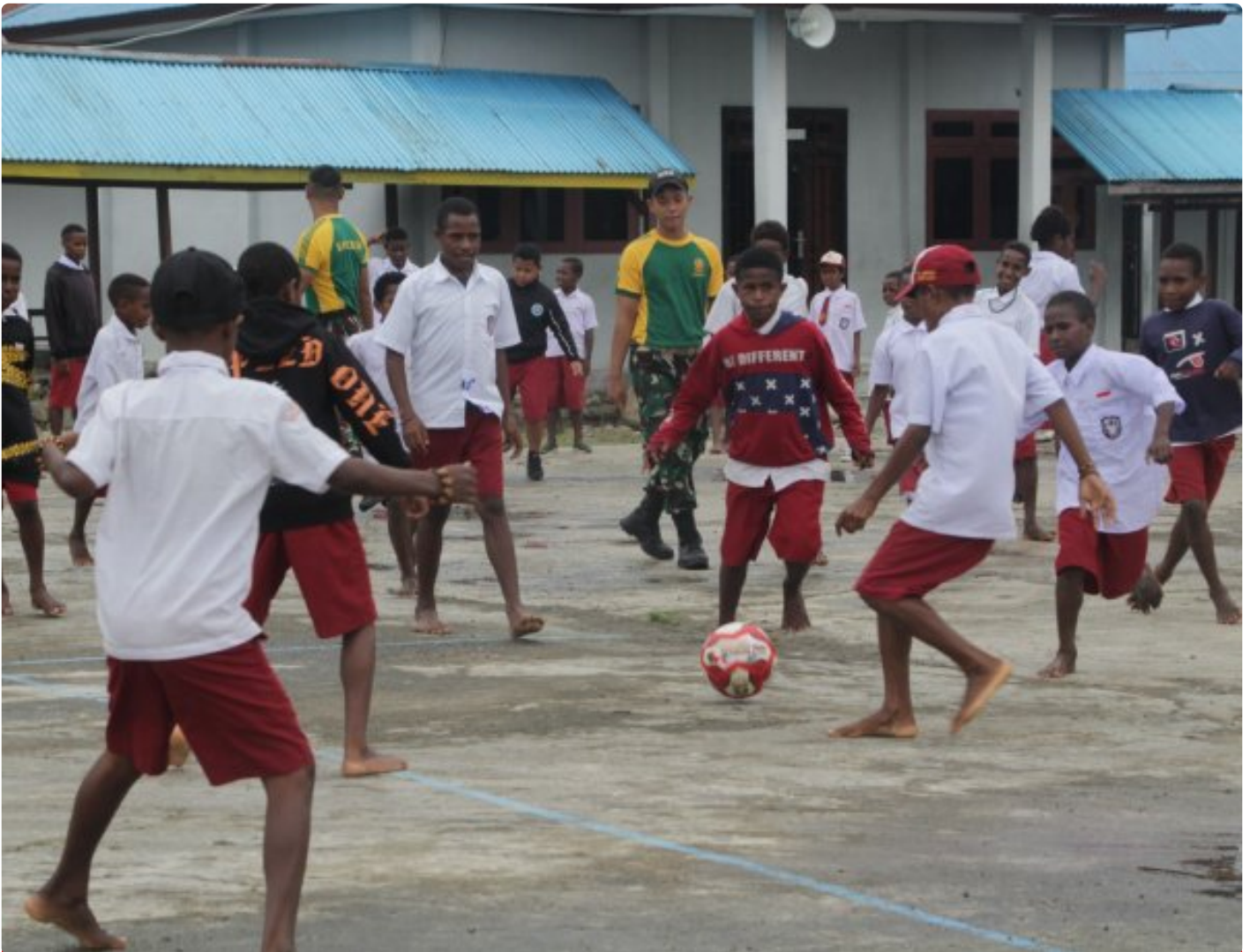
Foto: Saat Satgas Pamtas Mobile RI-PNG Yonif 503/Mayangkara mengajak main sepak bola siswa SD Inpres Kenyam, Distrik Kenyam, Kabupaten Nduga, Papua, Kamis 6 Februari 2025.